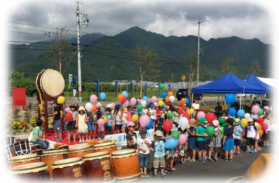
写真は昨年の様子です

おさんぽマルシェの出店者もくるよ！ かき氷・うどん・パン・焼き菓子・ 雑貨など、楽しみがいっぱい